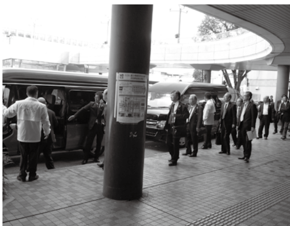
JR宇都宮駅西口のジャンボタクシー乗り場は、一時長蛇の列

大会当日は、当法人会の支部役員、青年部会、女性部会の執行部33名が運営部会の業務である乗降案内や会場までの誘導を担当。新幹線やチャーターバスで来県された大勢の会員皆様を歓迎しました。