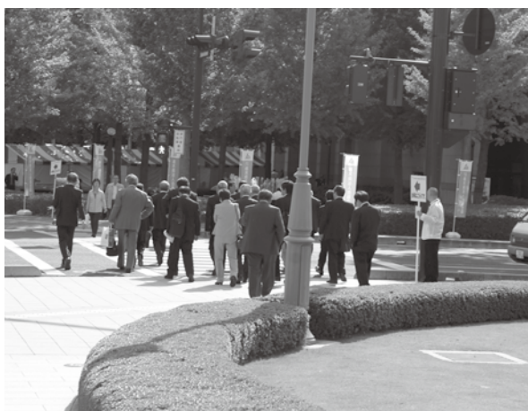
大会会場までの誘導案内