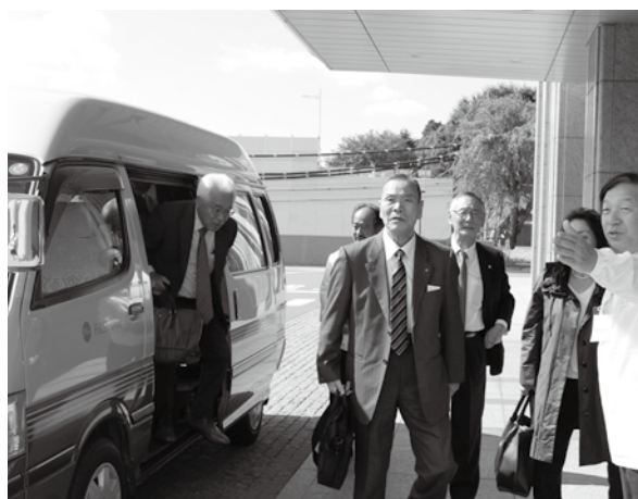
県庁舎内ではバス、タクシーの乗降案内