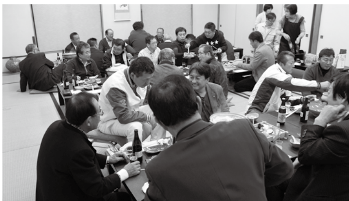
和やかな懇親会の様子