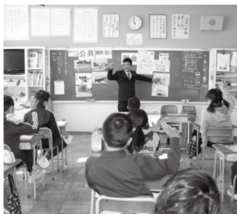
大内西小学校は真岡支部・青年部が担当