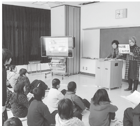
田野小学校は益子支部・女性部が担当

平成二十六年年度の講師役は、青年部が真岡支部と茂木支部、女性部は真岡支部、益子支部、市貝支部がそれぞれ地元小学校を担当しました。児童たちも真剣そのもので、税金クイズに答えたり、税に関するDV