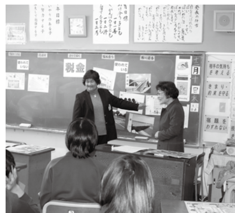
山前小学校は真岡支部・女性部が担当