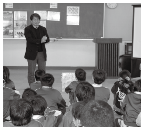
茂木小学校は茂木支部・青年部が担当