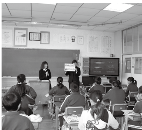
市貝小学校は市貝支部・女性部が担当

Dを観て、税金は生活を支える大切なものであることを正しく理解しました。また、回数を重ねることに講座内容を改善し、今年はジュラルミンケースに一億円（レプリカ）を用意。実際に手に触れた児童たちはその重さ（10kg）とその量にビックリしていました。