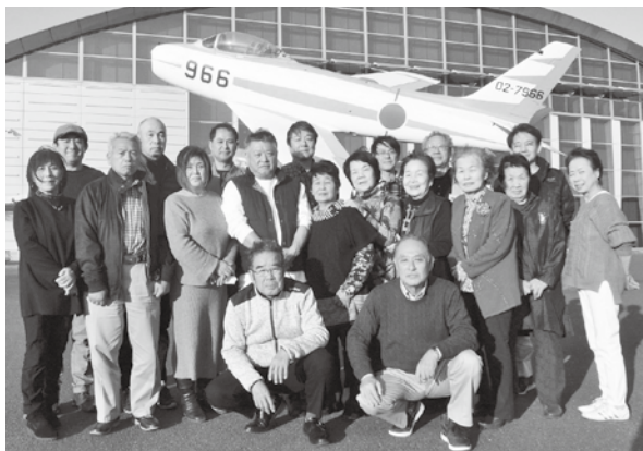
航空自衛隊浜松広報館 (エアパーク) にて

浜松といえば近年、宇都宮餃子のライバルに挙げられる餃子や鰻など全国的にも有名なグルメの宝庫です。そんな浜松の産業では、スズキ歴史館にて、機械機からスターとしてバイクから自動車に至るまでの経緯や、3D映像による製造工程を見学しました。