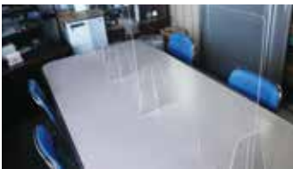
オリジナルアクリルパネル

また、飲食店やオフィス、食堂などの感染症対策として、飛沫防止用アクリルパネルも承っております。サイズや形状などお客様のニーズに応じて作成いたします。