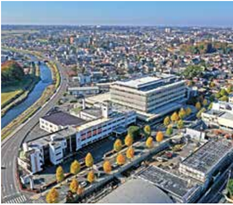
真岡市役所周辺を空撮 (芳賀の法人 216号表紙)

また、昨年より新事業として、ドローンによる空撮及び動画撮影を始めました。当社オペレーターは、DJICAMPスペシャリスト認定を受け、全国の飛行許可承認を取得さらに保険にも加入しておりますので、安心してお任せください。ドローン活用例としまして、