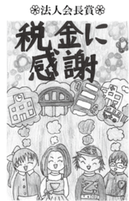
【真岡法人会女性部会長賞】