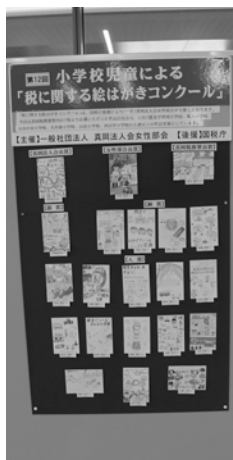
真岡市役所2月13日～26日

上位3賞と、真岡市役所には真岡市内の、芳賀町役場には芳賀東小の児童の優秀作品を中心に展示、税務署には優秀作品全点の展示を行いました。