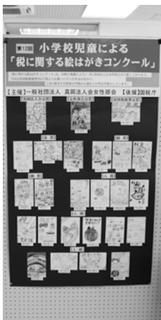
芳賀町役場2月16日～3月15日