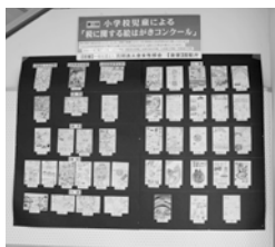
真岡税務署2月14日～3月15日